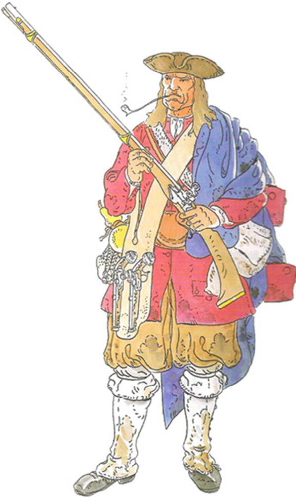
Dibuix: Francesc Riart i Jou © Editorial: ara LLIBRES ©

Els miquelets eren tropes que es mobilitzaven ocasionalment en defensa del país. Tanmateix, tant la Corona Francesa com l'Espanyola van aixecar i finançar companyies o bandes de miquelets per sostenir campanyes. Sovint van acabar essent unitats a sou molt vinculades a un cap carismàtic. Sovint les seves accions van fregar el guerrillerisme i el bandolerisme. El seu armament, com hem assenyalat, era singular: fusell o escopeta, un parell de pistoles, sabre, etc.